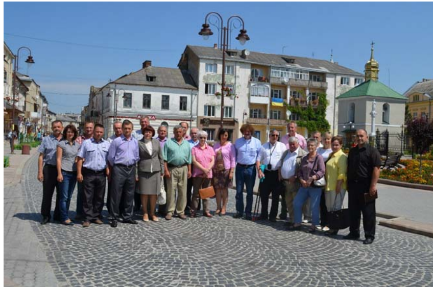
Партнерська угода діє з 1996 року

Площа — 35,36 км 2 . Населення становить 11 405 осіб (станом на 31 грудня 2016)