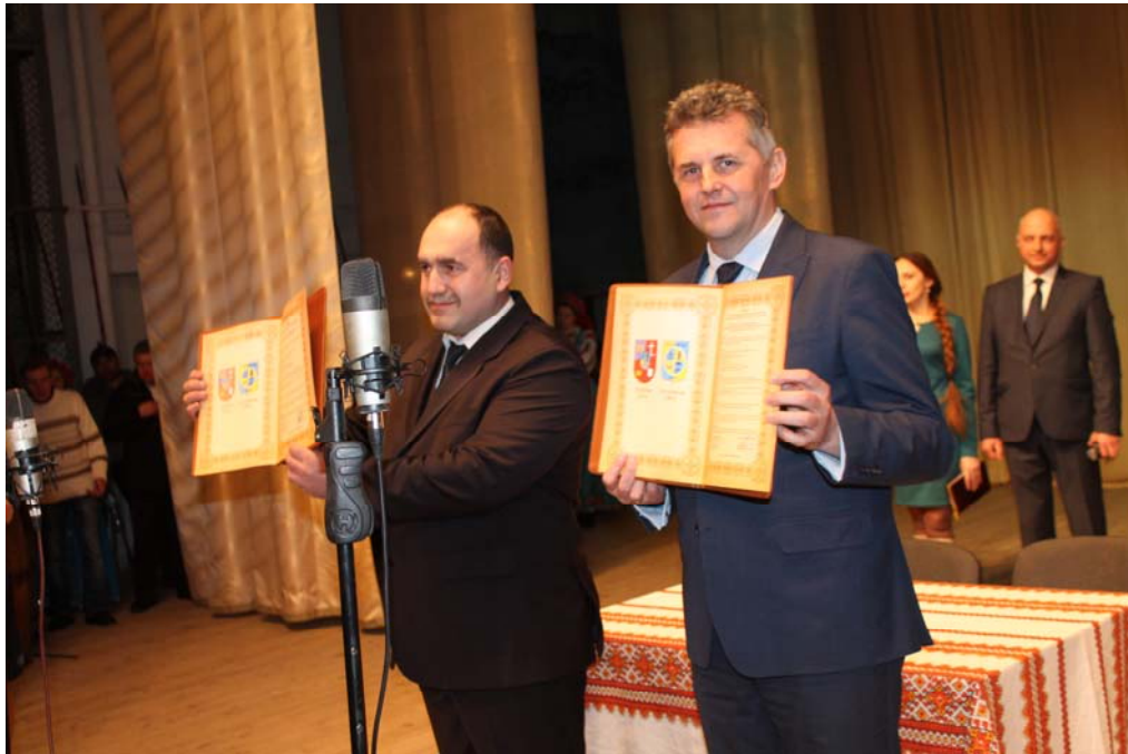
Партнерська угода діє з 2017 року

Скадовськ — кліматологічний курорт, щороку місто відвідує близько 50 000 осіб.