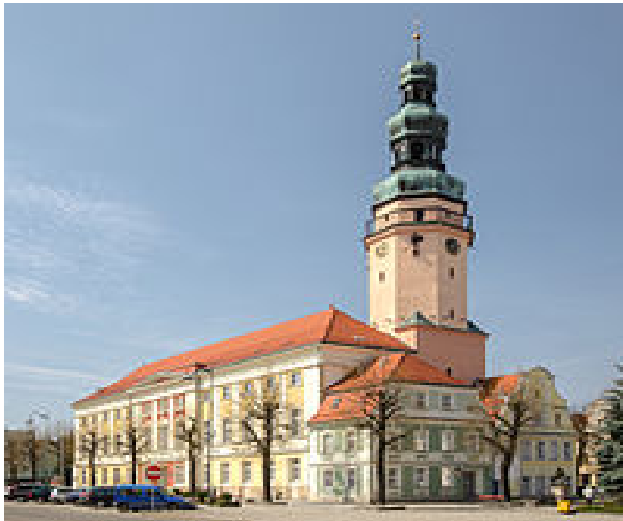
Партнерська угода діє з 2002 року

Адміністративний центр Олавського повіту Нижньосілезького воєводства.